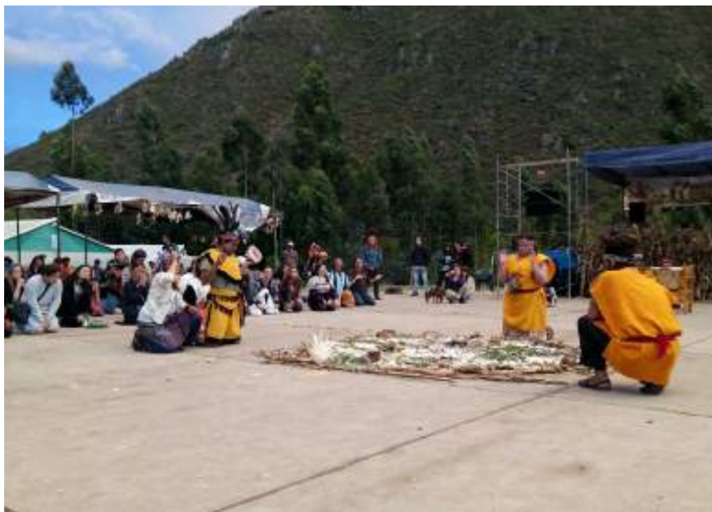
Taqui realizando una ceremonia con motivo del Sara Raymi.