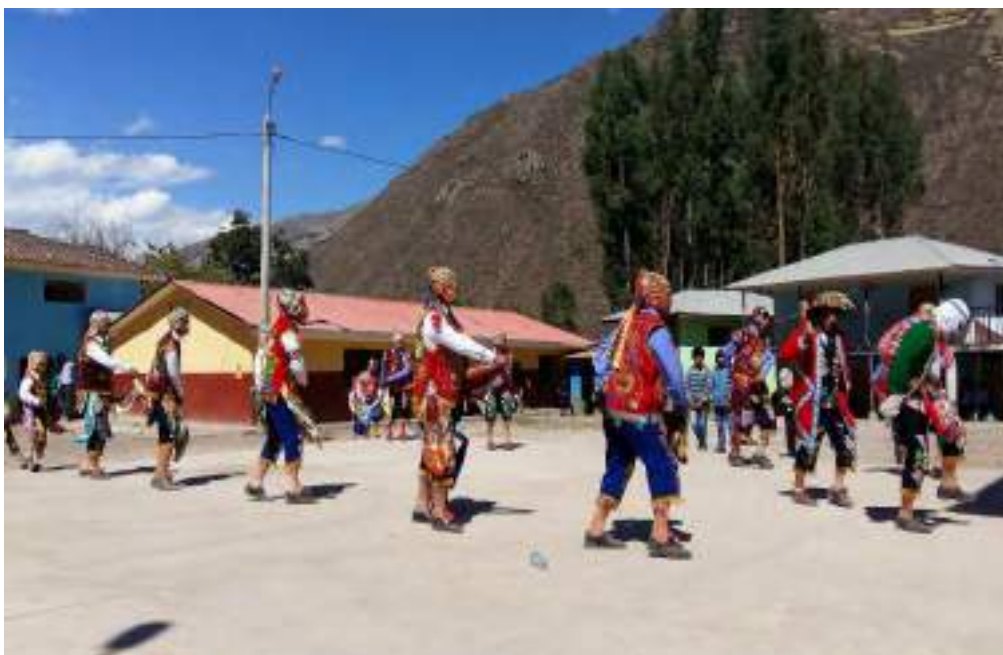
Danza típica presentada por los jóvenes de la comunidad en la fiesta de la Virgen del Carmen