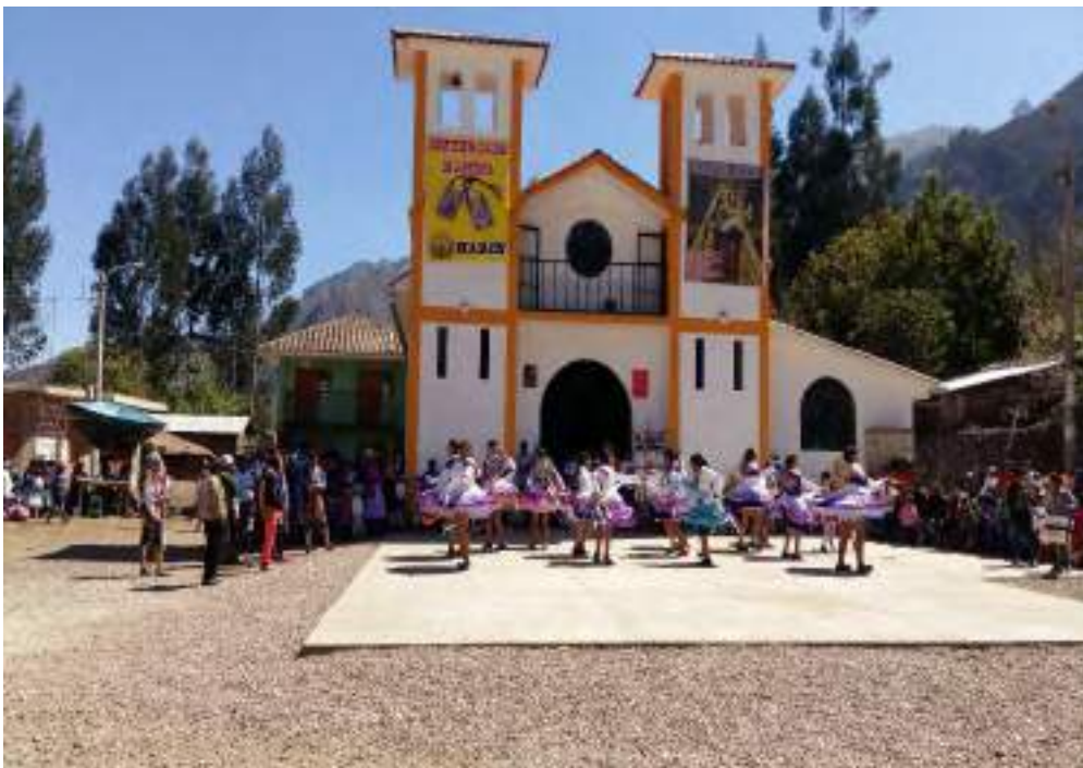
Danza presentada por mujeres de Arin en la fiesta de la Virgen de Carmen.