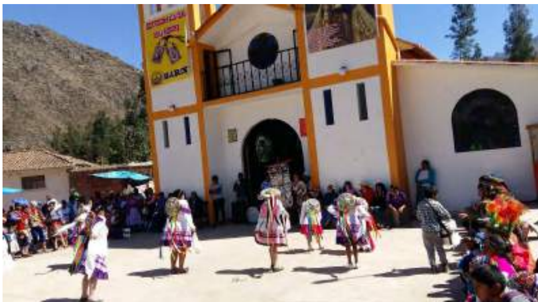
Fotografía No 4: Celebración de la fiesta patronal de la Virgen del Carmen.