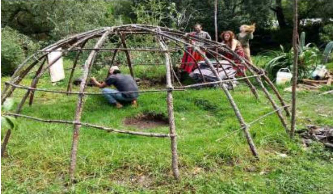
Preparación previa del lugar antes de la ceremonia de temazcal.