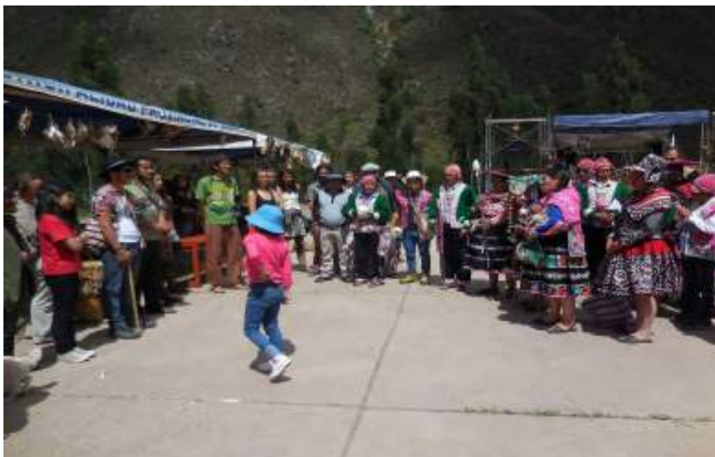
Participación en el Sara Raymi de comuneros de otras comunidades.