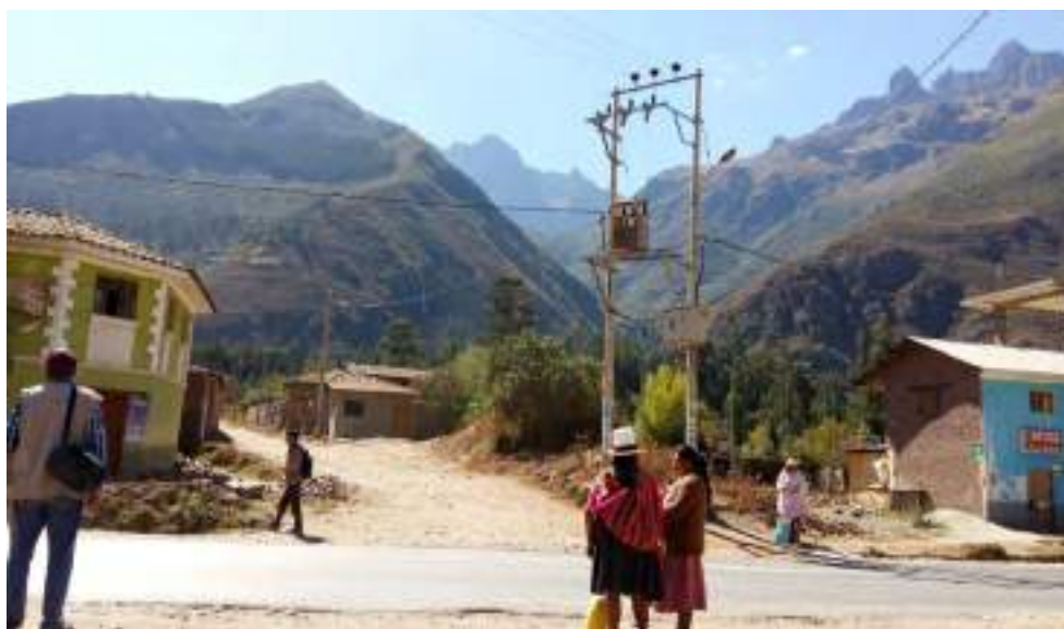
Fotografía No 1: Camino de acceso principal a la comunidad campesina de Arin.

Para el transporte vehicular, existe transporte local, ofrecido por empresas formales, que arriban a los terminales terrestres de Calca y Urubamba. Así también existen un volumen importante de autos, vehículos pesados y otros que se desplazan por la ruta. Existen un número de trochas algunas vehiculares y peatonales para el desplazamiento entre comunidades y de ellas hacia vías o centros de mayor accesibilidad. La mayoría de accesos son trochas que conectan las áreas del cultivo las que han venido consolidando por la ocupación de viviendas. Existen también caminos de herradura como es el de Churo – Canchacancha.