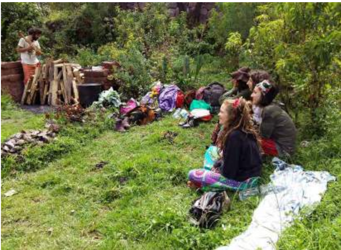
Visitantes extranjeras observando la preparación de la ceremonia de temazcal