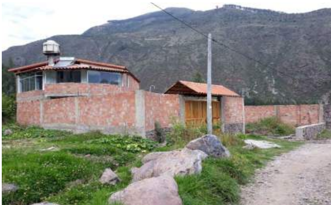
Fotografía No 7: Vivienda de material de cemento en proceso de construcción ubicada dentro de la comunidad de Arin.

En cuanto al tema de vivienda, la mayoría de inmigrantes alquilan habitaciones o casa enteras ubicadas dentro de la comunidad.