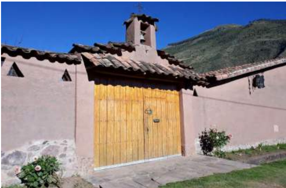
Fotografía No 9: Fachada de vivienda de residente extranjero hecha de adobe y barro.