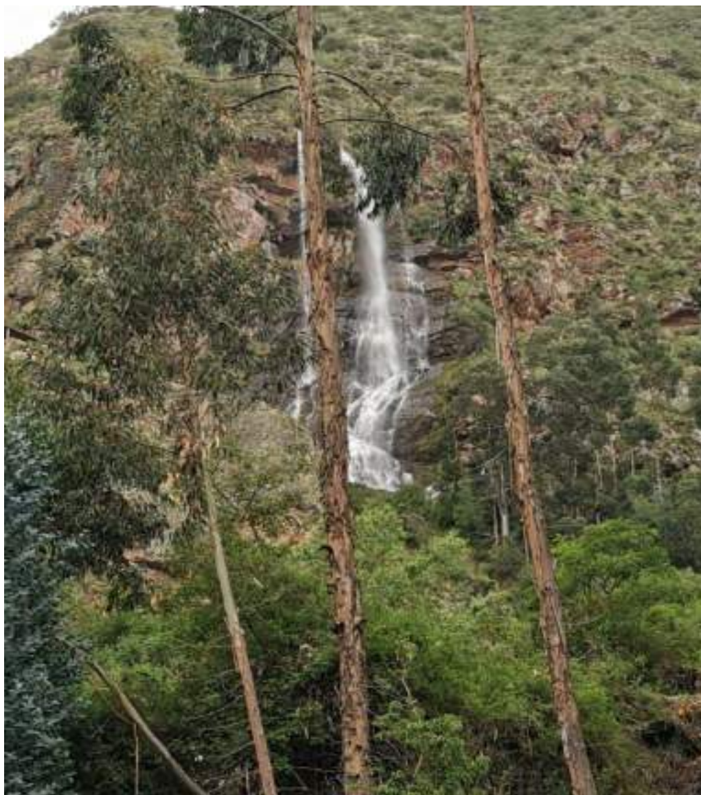
Fotografía N° 10: Catarata de Arin.