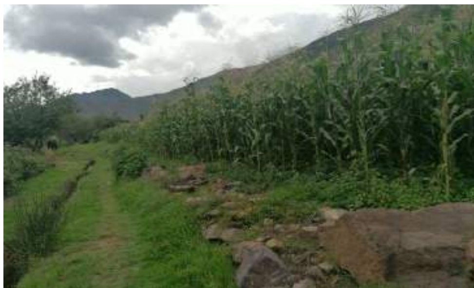
Fotografía N°5: Cultivo de maíz blanco.

Recientemente el cultivo de fresas implementado por la Municipalidad Distrital de Calca se ha vuelto en una alternativa para la comunidad. PROCOMPITE, junto a la Asociación de Productores Sumaq Fresa se encargan del mejoramiento de la producción de fresa bajo invernadero trabajando desde febrero del 2017.