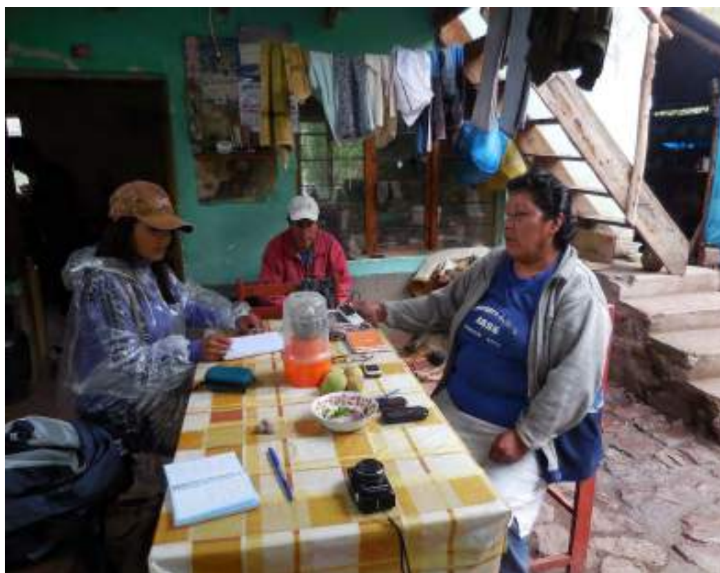
Entrevista a una habitante de la comunidad campesina de Arin.