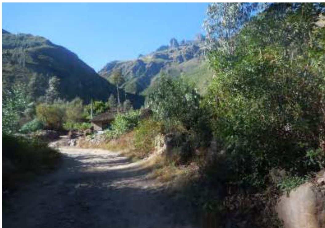
Pasaje a de acceso camino a la cascada de Arin.