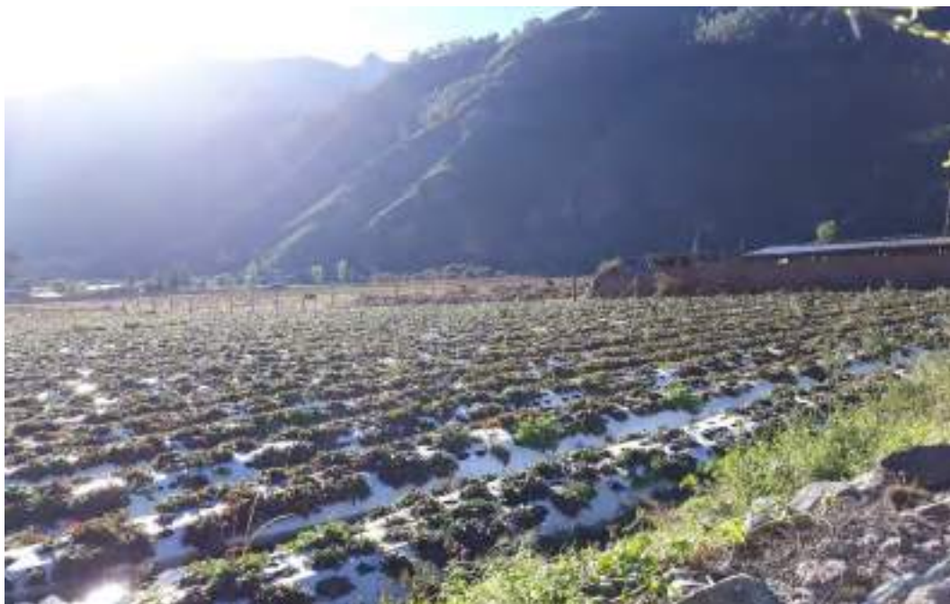
Fotografía No 6: Cultivo de fresas.

Para el correcto funcionamiento de este plan de negocio existe una junta directiva en la asociación.