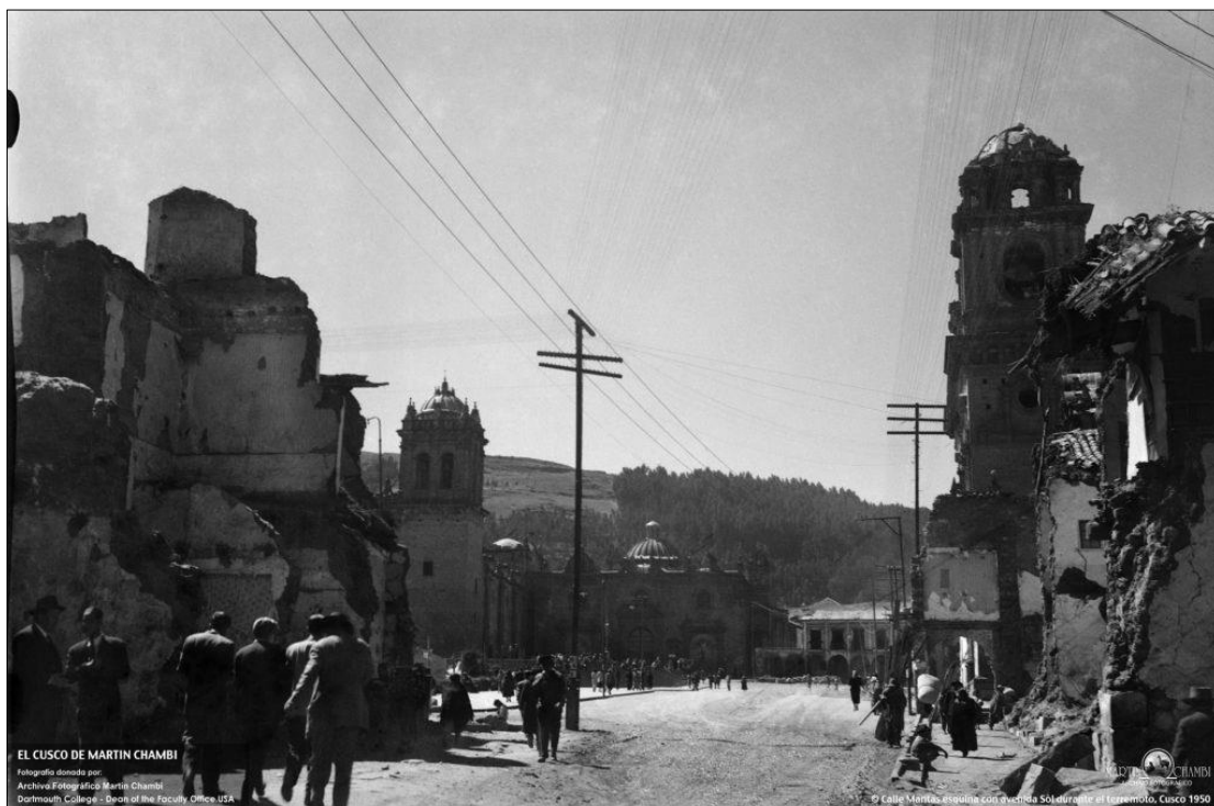
Imagen N° 3