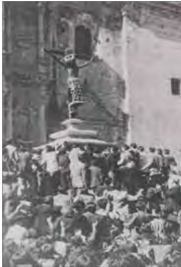
Imagen N° 4