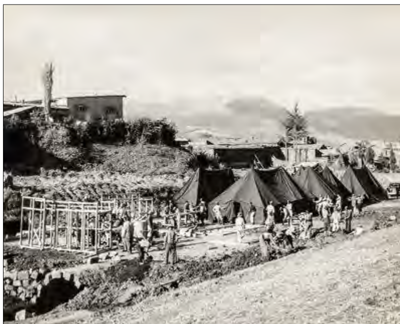
Imagen N° 5