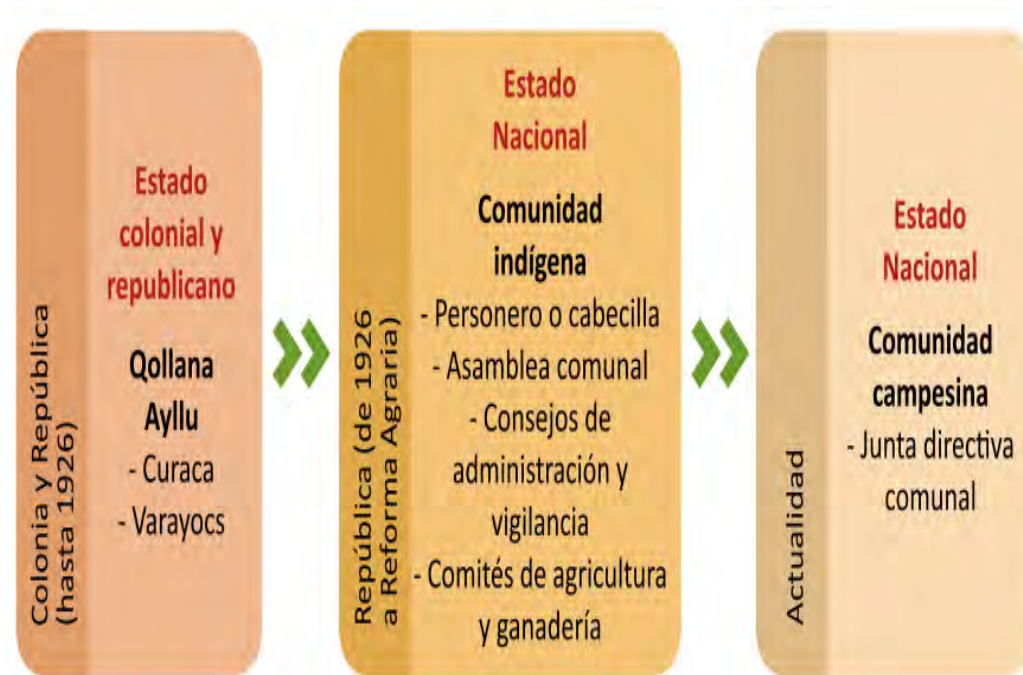
Figura 3 Evolución del gobierno en Pampachiri

Nota. Ilustración de la evolución histórica del gobierno comunal en Pampachiri. Tomada de Pajuelo (2019, P.97)