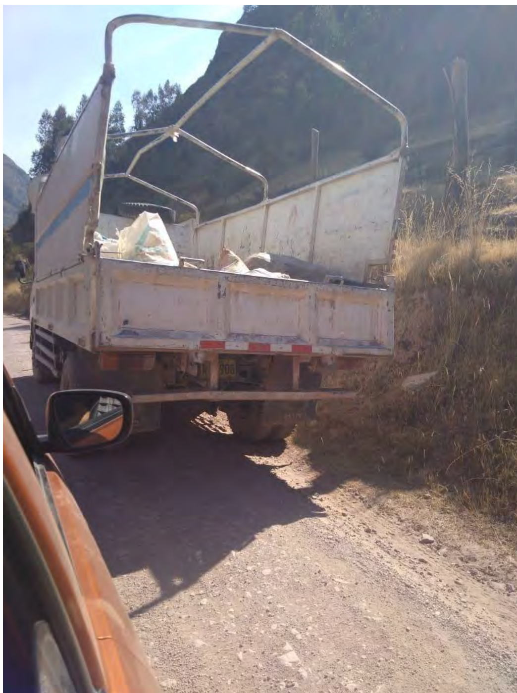
Fotografía N°2 Camión basurero en Pampachiri rumbo a la municipalidad de Pitumarca