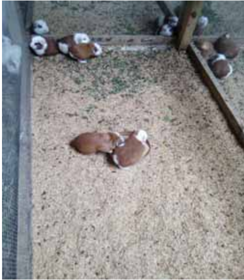
Figura 8.- Alimentación de cuyes con alfalfa fresca