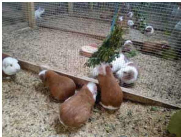
Figura 9.- Cuyes a la séptima semana