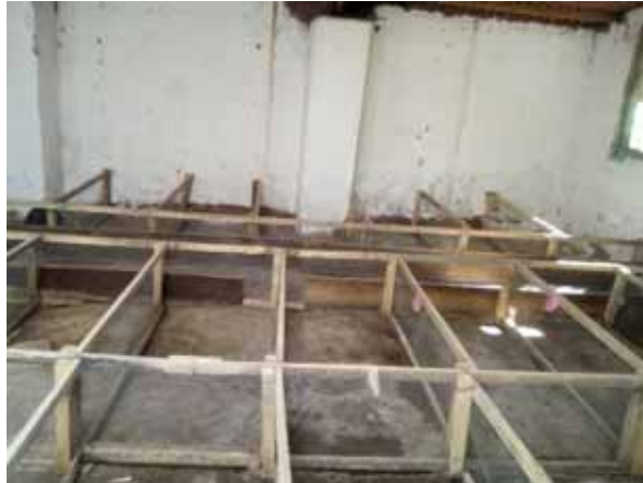
Figura 5- Pozas con camas de cascarilla de arroz