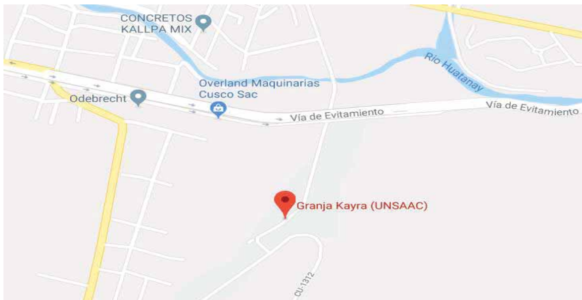
Figura 1.- Ubicación geográfica del lugar de experimento.