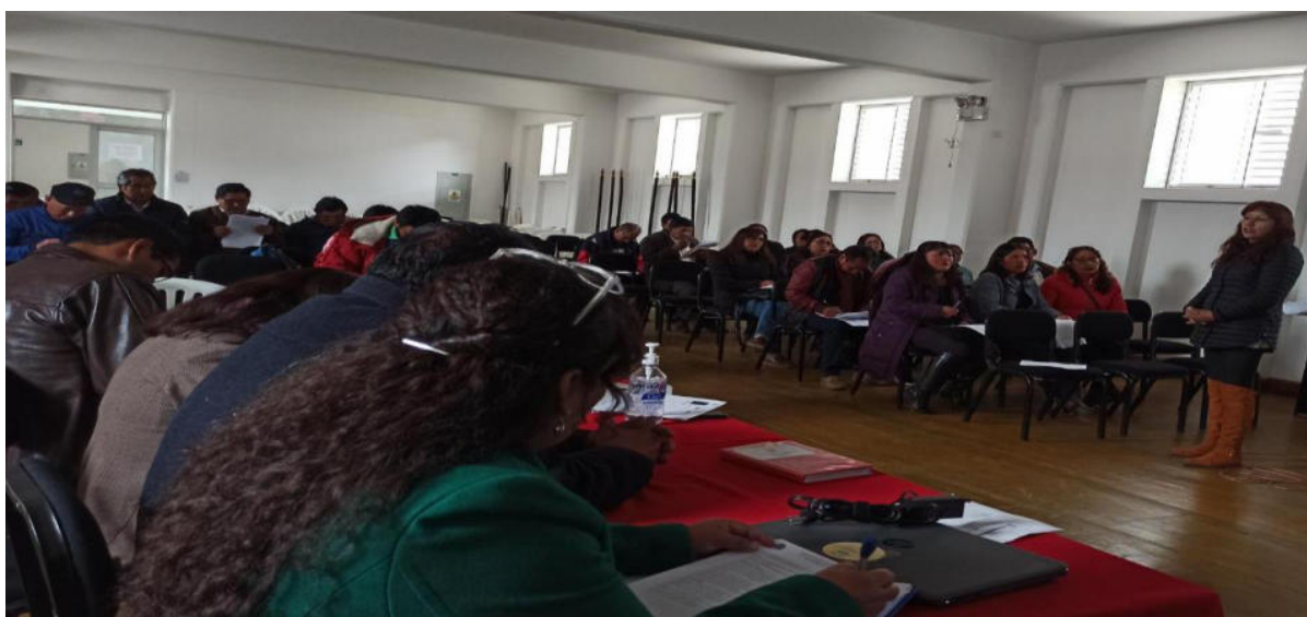
FOTOGRAFÍA N° 2 momento en que se realiza la indicación sobre el instrumento de recojo de datos en los docentes del colegio Mateo Pumacahua de Sicuani.