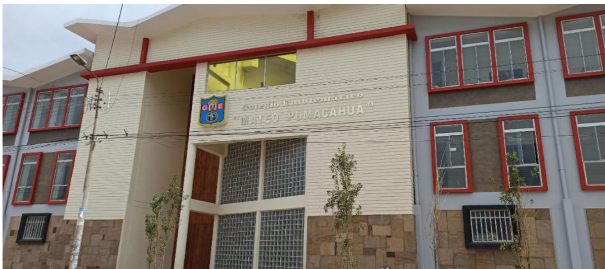
FOTOGRAFÍA N° 1 Momento de ingreso Ala IE Mateo Pumacahua para aplicar el cuestionario