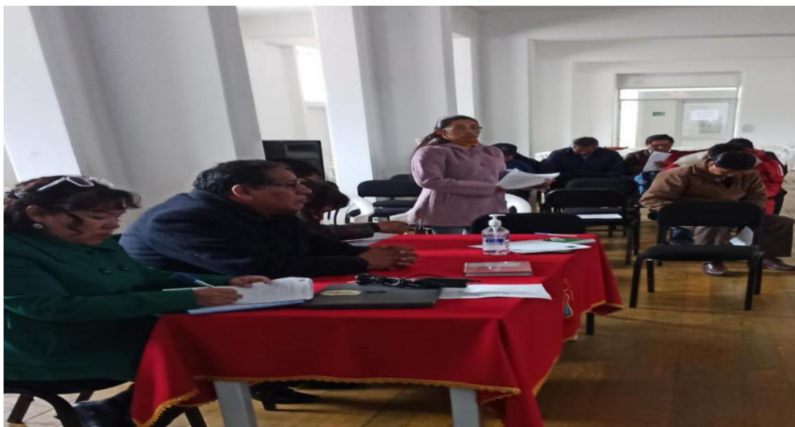
FOTOGRAFÍA N° 4 momento de la finalización del cuestionario de los Docentes del colegio Mateo Pumacahua -Sicuani.