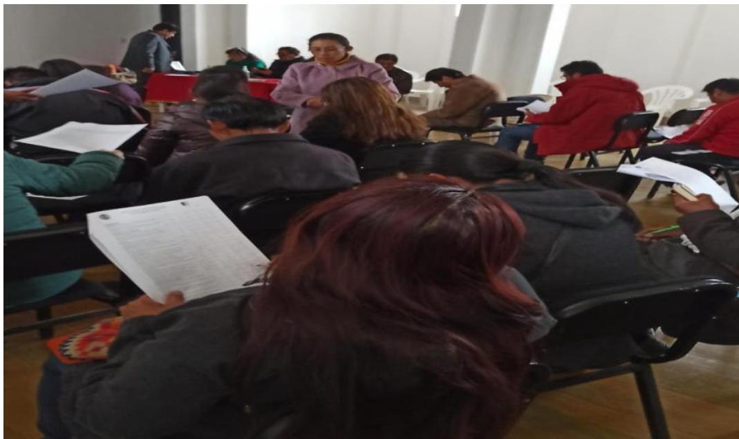
FOTOGRAFÍA N° 3 momento de la aplicación del cuestionario a los docentes del I.E Mateo Pumacahua.