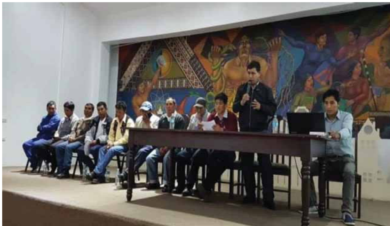
La comisión de autoridades y dirigentes de Chamaca realizando conferencia de prensa en la ciudad de Cusco, tras la ruptura de la mesa de dialogo con la empresa HUBBAY en la ciudad de Lima.