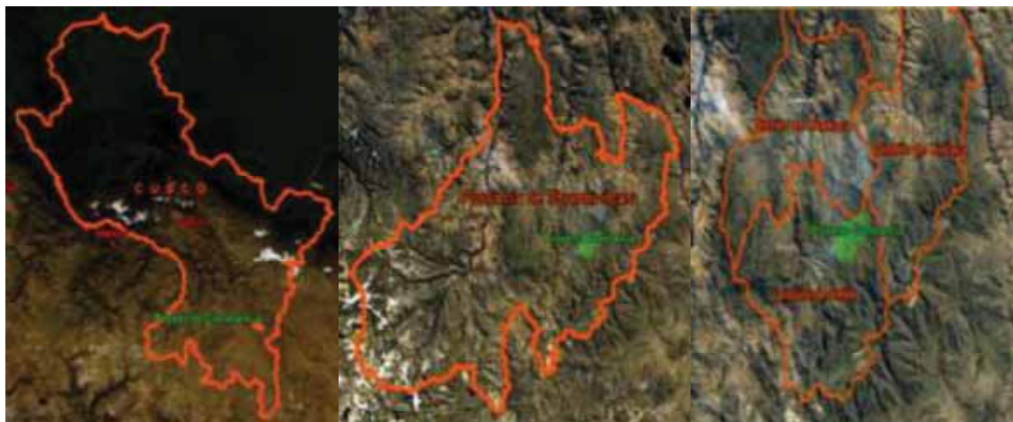
Cuadro N° 21: Resumen de datos importantes del proyecto Constancia