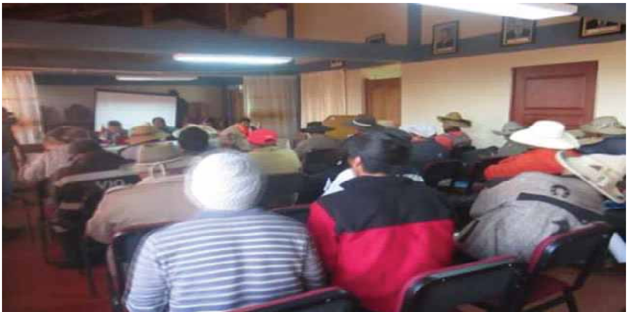
El desarrollo de la mesa de dialogo en el auditorio de la Municipalidad Distrital de Chamaca, participan el Estado, la empresa y la sociedad civil