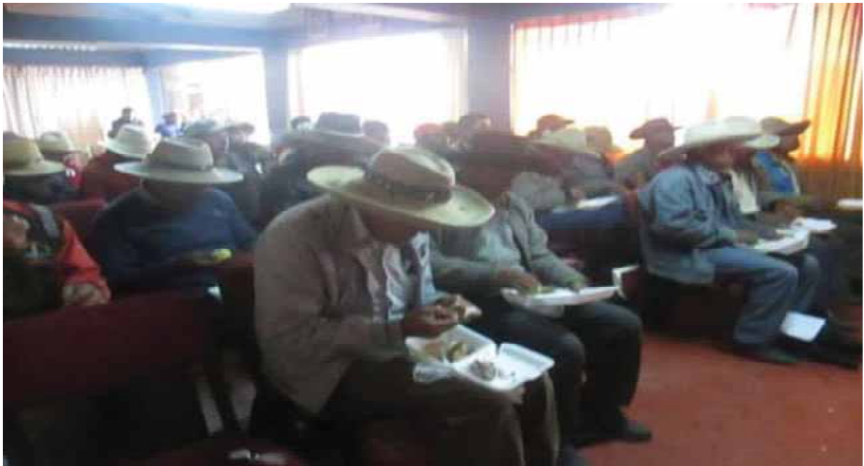
Refrigerio en la mesa de diálogo, invitado por la Municipalidad a todos los participantes