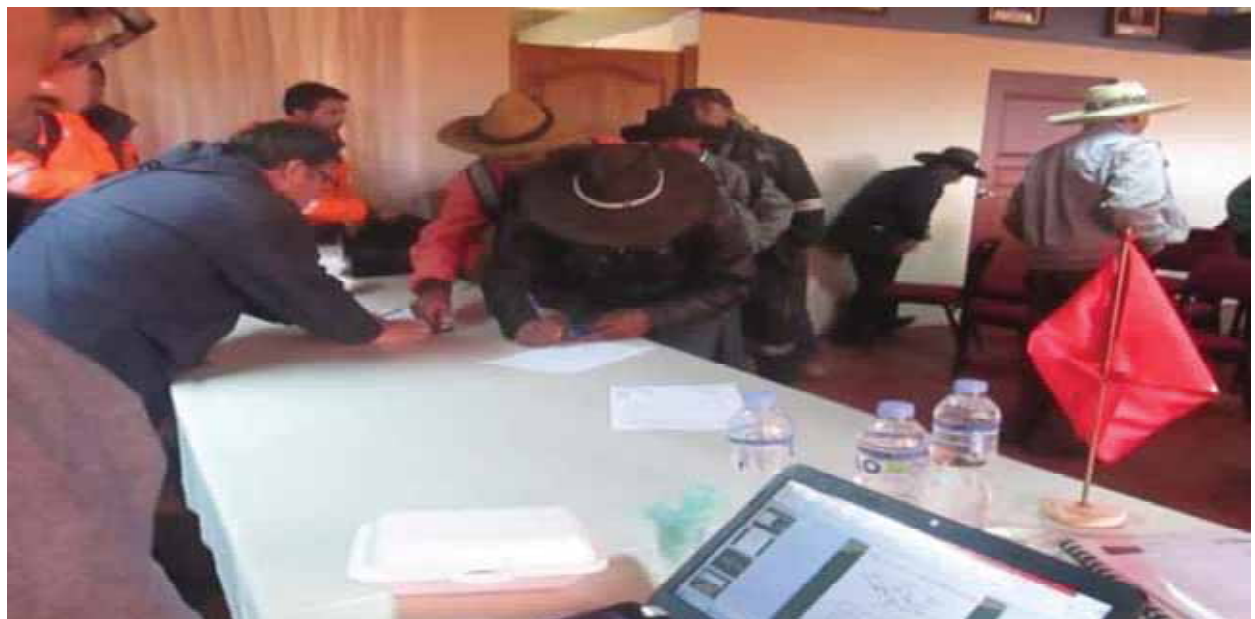
Autoridades y dirigentes firmando el acta de la mesa de diálogo, al finalizar el evento.