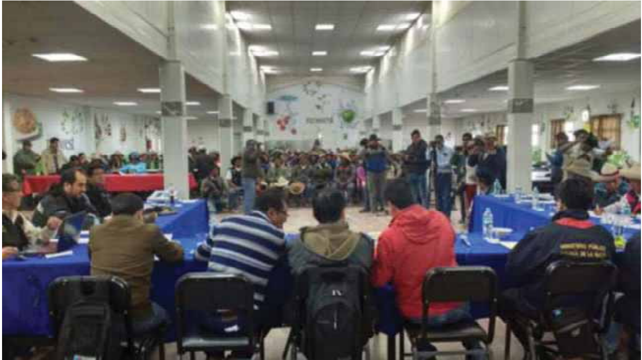
Instalación de la mesa de dialogo en el campamento Fortunia de Hudbay con una “Comisión de Alto Nivel” del ejecutivo nacional, tras el conflicto minero del 2016.