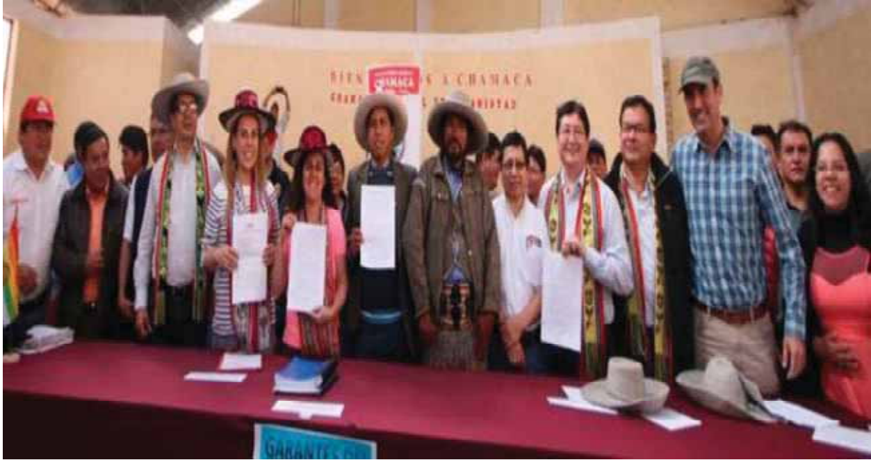
Los representantes de los diferentes Ministerios, el Alcalde de Chamaca, dirigente de FUDICHA y el representante de Hudbay, muestran las actas firmadas de la sesión.