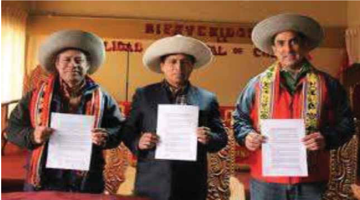
El Facilitador de la OGGs – MINEM, el Alcalde de Chamaca y el Representante de la empresa Hudbay, muestran el convenio específico firmado.