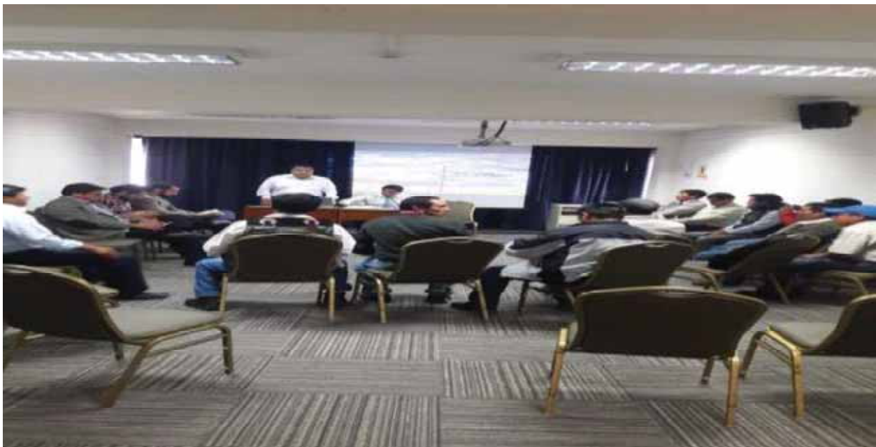
La comisión de autoridades y dirigentes de Chamaca dialogando con los funcionarios de MINEM y representantes de Hudbay, en el despacho de OGGS – MINEM en Lima, a fin de agotar el Dialogo.