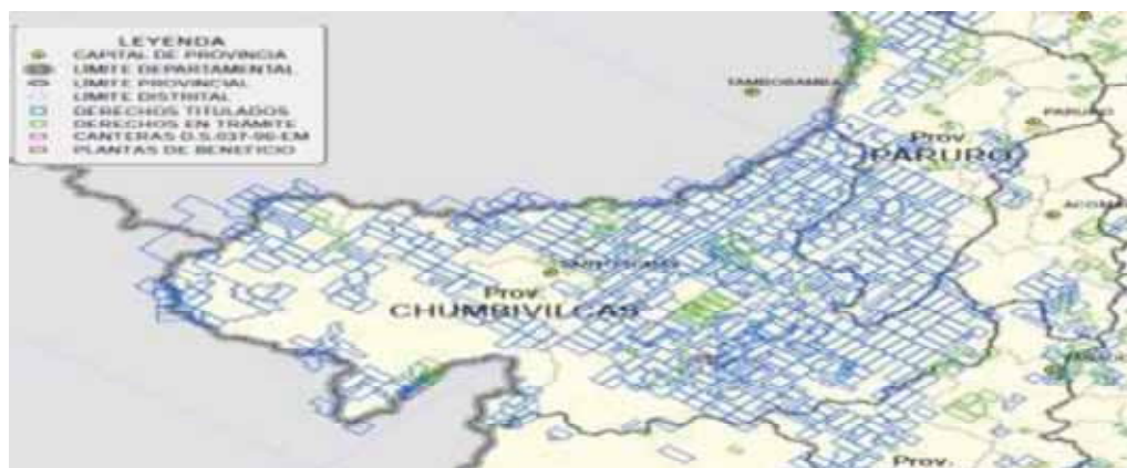
Figura N°3 Mapa minero catastral de la provincia de Chumbivilcas

Entre las principales empresas beneficiadas con las concesiones mineras resaltan: la Compañía Minera ARES SAC, HUBBAY Perú SAC, Compañía de minas Buenaventura S.A.A. Fresnillo Perú, Panoro Apurímac S.A. y Golden ideal Gold Mining S.A. Entre las de que tienen mayor participación, está la operación minera Minas pata (Anabí), yacimiento epitermal de alta sulfuración de oro, plata, cobre y molibdeno que se encuentra dentro de la franja metal genética, sus reservas se han calculado en 37.2 Mt@ 0.39 g/t Au