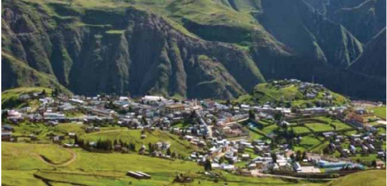
Vista panorámica del distrito de Chamaca - Chumbivilcas