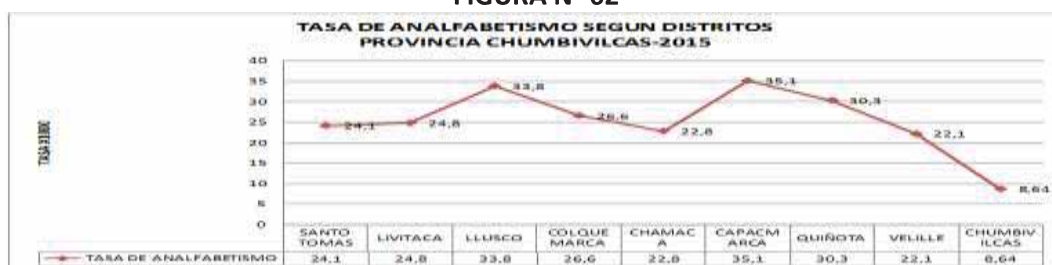
FIGURA N° 02

Fuentes: 1/ Estimaciones y Proyecciones de Población por sexo, según Departamento, Provincia y Distrito, 2000-2015