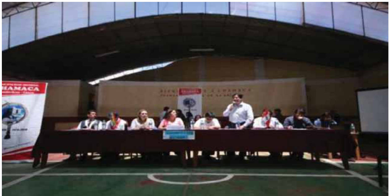
Continuación de la mesa de dialogo con los diferentes Ministerios del ejecutivo nacional en el campo recreacional del distrito de Chamaca.