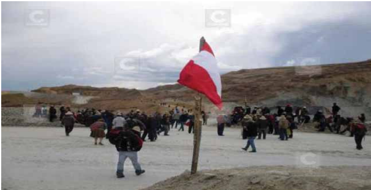
Los pobladores de Chamaca en el tajo “constancia” realizando la huelga indefinida contra la empresa Hudbay, noviembre del 2016