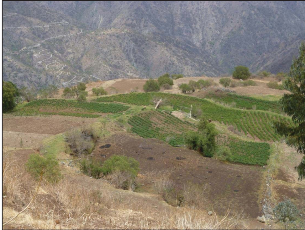
Tierras agrícolas de la comunidad campesina de Roccoto Cedrone foto tomada el 28/01/2014