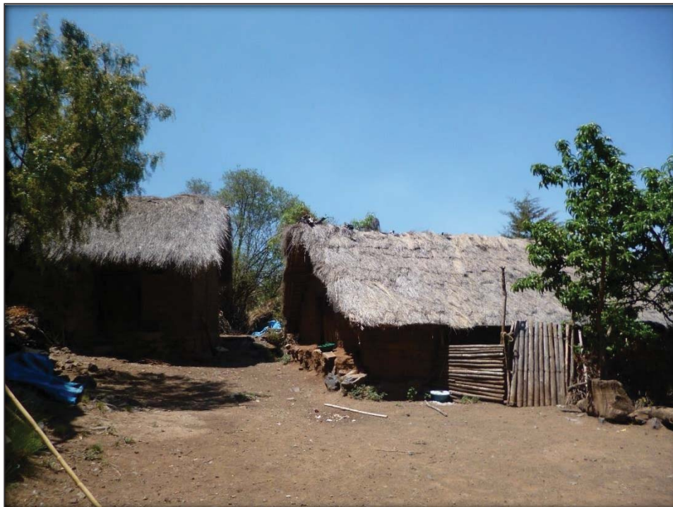
Vivienda en la Comunidad Campesina de Roccoto Cedrone foto tomada el 10/10/2016