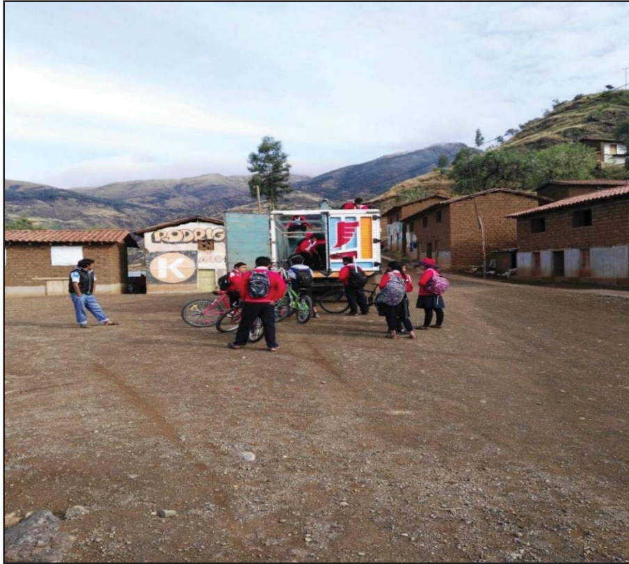
Camión que transporta a los alumnos de secundaria al centro educativo ubicado en Huanca Huanca foto tomada el 01/10/2016