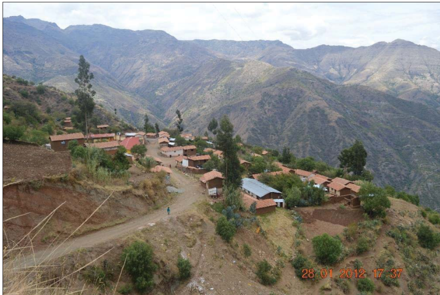
Comunidad campesina de Roccoto Cedrone foto tomada el 28/01/2012