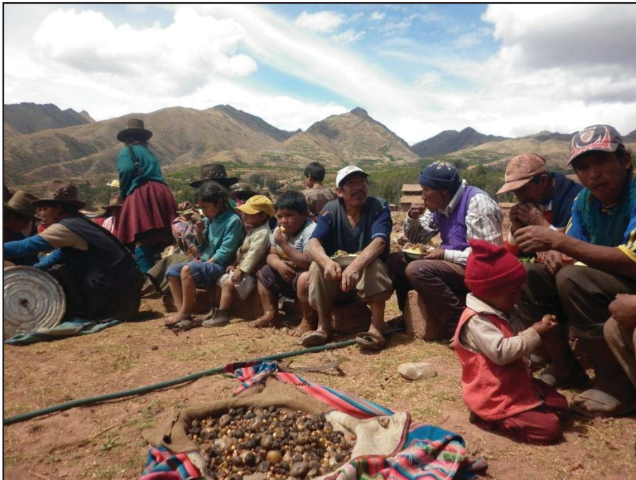
Merienda durante el trabajo comunal para la elaboración de adobes para la comunidad