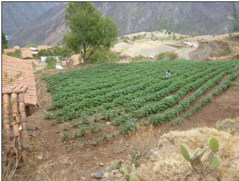
Chacra sembrada en el sector de mosomasav en la campesina de Roccoto Cedrone foto tomada el 28/01/2014