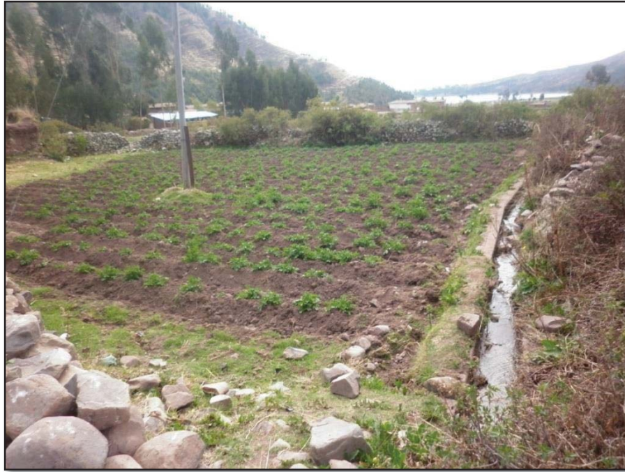
Canal de Riego de la Comunidad Campesina de Roccoto Cedrone 10/10/2016