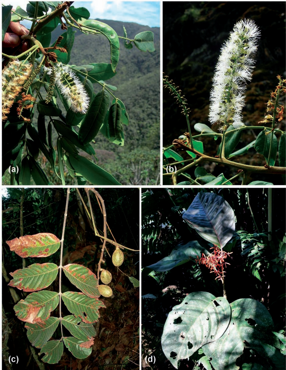
Figura 2. (a) y (b). Punjuba lehmannii , (c). Cedrela saltensis , (d). Neea boliviana .