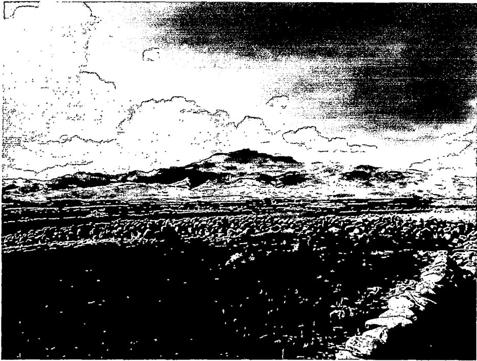
FOTOGRAFÍA N° 3: CORRALES USADOS PARA SEMBRAR PASTOS ASOCIADOS. PULPERA-CONDES.06/09/13. CLAU SUAREZ.