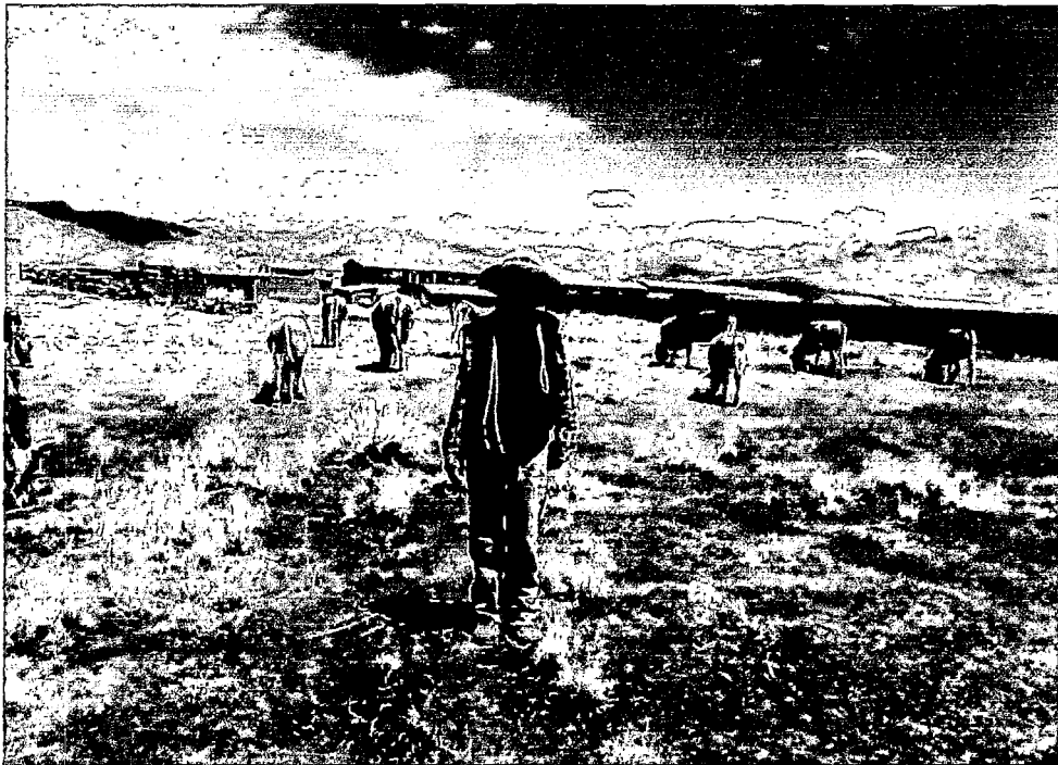
FOTOGRAFÍA N° 4: CAMPESINO PRODUCTOR DE GANADO BROWN SWISS PASTANDO DENTRO DE SU PARCELA EN LOS ALREDEDORES DEL CENTRO POBLADO. PULPERA-CONDES.08/07/13. CLAU SUAREZ.