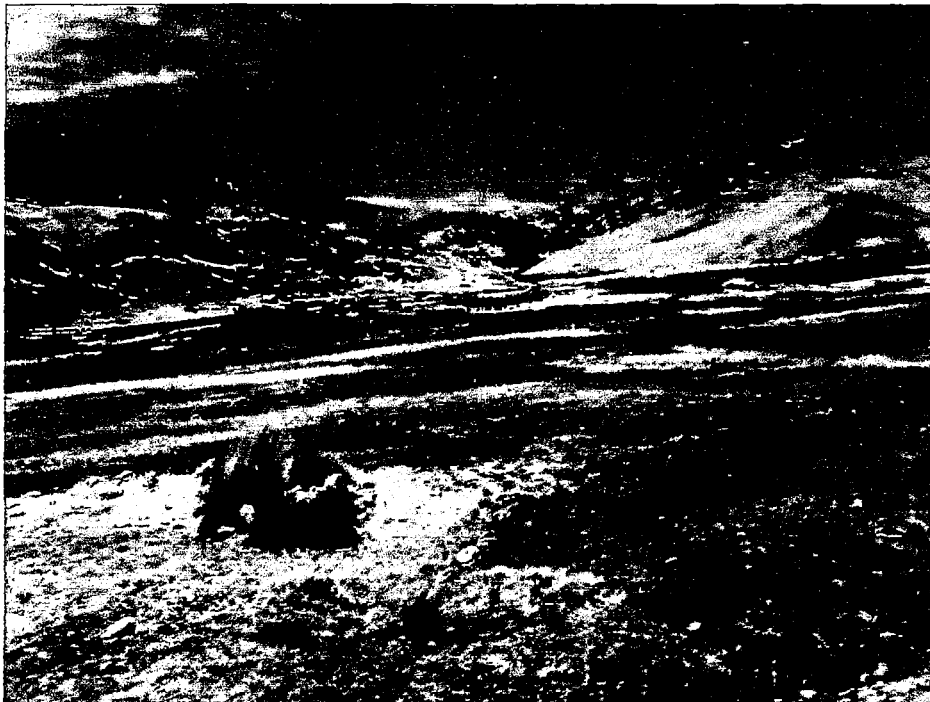
FOTOGRAFÍA N° 2: PASTOS ASOCIADOS ADOPTADOS POR LOS CAMPESINOS. PULPERA-CONDES. 05/01/14. CLAUS SUAREZ.