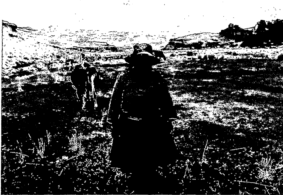
FOTOGRAFÍA N° 5: CAMPESINA PASTANDO SU GANADO MEJORADO DENTRO DE SU PARCELA. PULPERA-CONDES.08/12/13. CLAUS SUAREZ.