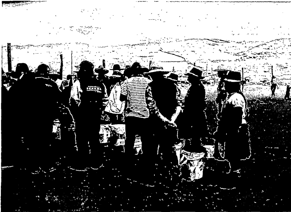
FOTOGRAFÍA N° 9: DESPUÉS DEL ORDEÑO, ESPERANDO LOS RESULTADOS PARA DETERMINAR AL GANADOR.PULPERA-CONDES.09/09/13. CLAUS SUAREZ.