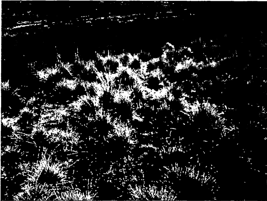
FOTOGRAFÍA 1: COBERTURA VEGETAL SIN PASTOS ASOCIADOS. PULPERA-CONDES. 08/07/13. CLAUS SUAREZ.