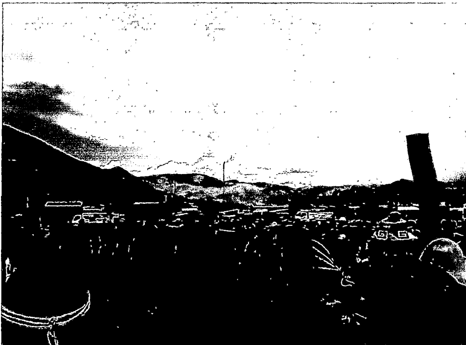
FOTOGRAFÍA N° 8: GANADO EN PLENO JUZGAMIENTO CONJUNTAMENTE CON LOS POBLADORES. PULPERA-CONDES. 09/09/13. CLAUS SUAREZ.