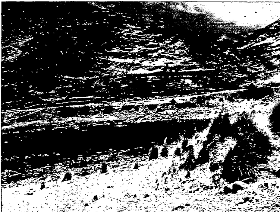
FOTOGRAFÍA N° 6: CUENCA DEL RIO DE VELILLE, RECURSO IMPORTANTE PARA LA GENERACIÓN DE PASTOS ASOCIADOS. PULPERA-CONDES.10/11/13. CLAUS SUAREZ.