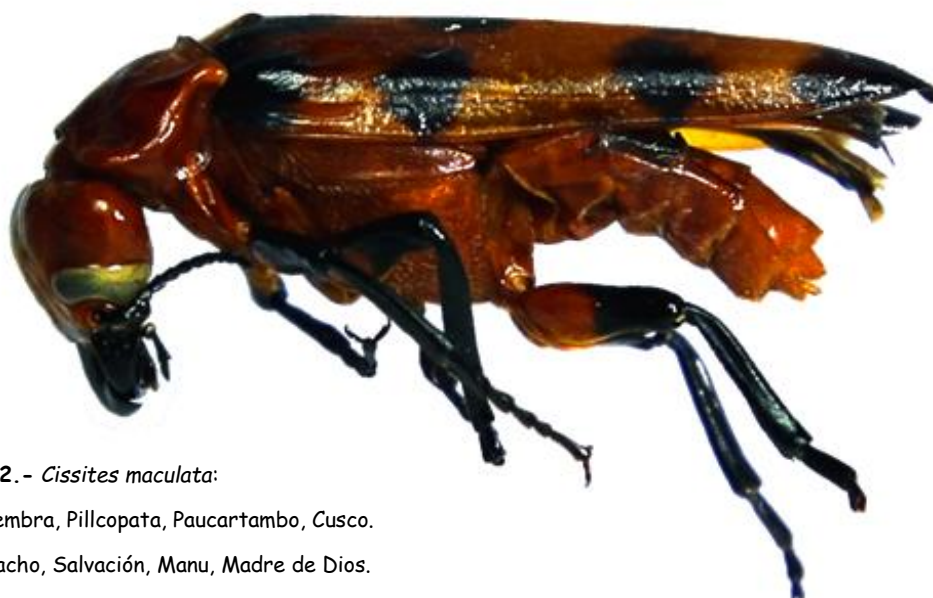
Figs. 1 y 2.- Cissites maculata :

1.- Hembra, Pillcopata, Paucartambo, Cusco.