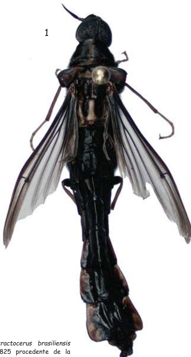
Fig. 1.- Vista dorsal de Atractocerus brasiliensis Lepelletier & Audinet-Serville 1825 procedente de la localidad de Maranura, región Cusco, Perú.

Wheeler, Q.D. 1986. Revision of the genera of Lymexylidae (Coleoptera: Cucujiformia). Bulletin of the American Museum of Natural History 183 : 113-210.