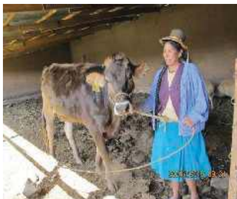
Fotografía N°07: Crianza de Vacunos de Leche en la Comunidad de Yuttu.

En la tabla N° 12, podemos apreciar que, el número de familias dedicadas a la actividad son pocas; sin embargo, cuentan con buena cantidad de animales, en promedio de 3 a 5 cabezas por familia, y la producción para la cantidad de animales va en ascenso por tratarse de animales mejorados llegando a ser más rentable para la producción. Así mismo en el distrito existen familias que no se encuentran empadronadas en las comunidades que se dedican con mayor fuerza a la actividad las que también se dedican a la transformación.