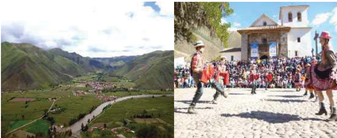
Fotografía 1 y 2, Vista panorámica de Andahuaylillas y la Capilla Sixtina de América.

El 21 de Abril del 2010 fue declarado como Patrimonio Cultural de la Nación con Resolución Directoral N°882 del Instituto Nacional de Cultura. Asimismo, el 31 de Octubre del 2012, se realizó el lanzamiento nacional de Andahuaylillas como pueblo integrante del Programa Nacional de Turismo inclusivo: “De mi tierra un producto”, del Ministerio de Comercio Exterior y Turismo. a la que asistieron el Ministro de Cultura Luis Alberto Peirano Falconi y el Ministro de Comercio Exterior y Turismo, José Luis Silva Martinot, además de autoridades regionales y provinciales. En Cusco ganaron dos poblados: Andahuaylillas y Raqchi.