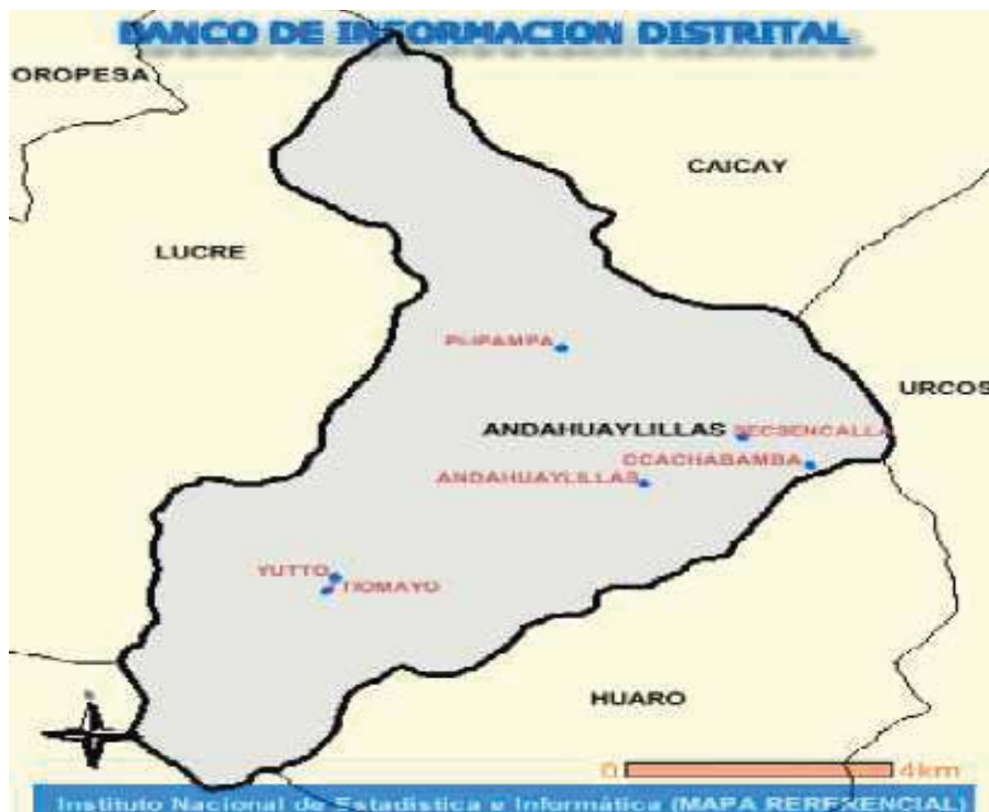
Mapa N° 1. Distrito de Andahuaylillas