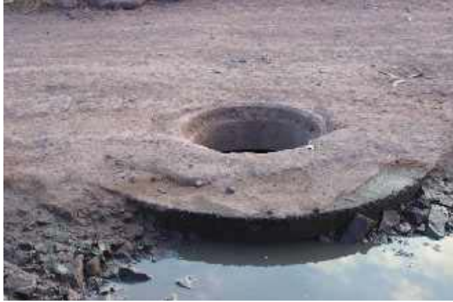
Fotografía N°10 Buzones de desagüe en Piñipampa, Enero 2015

La gestión 2011 - 2014 se ha caracterizado por desarrollar la economía local del distrito, basada en la realización de diferentes ferias comunales. El incremento de las ferias en el distrito de Andahuaylillas se ha generalizado en todas sus comunidades y en el centro poblado. El rol de las ferias comunales es acercar el mercado hacia el productor y a partir de ello generar economía familiar y contactos comerciales, ese es el verdadero rol de las ferias.