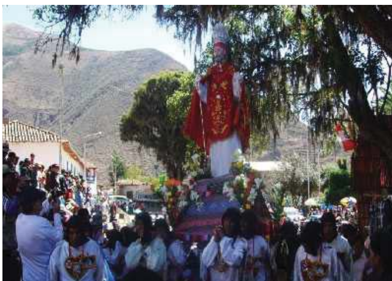
Fotografía N°09: festividad religiosa de San Pedro y San Pablo.

Un lugar especial de este baluarte cultural lo ocupa su iglesia. Al acudir a ella, no es solo un contacto con el arte de alabanza al creador, sino un homenaje de trabajo la multitud de artistas de la zona que interpretan el arte europeo dentro de su visión andina y que nos dejaron como aporte del arte mural andino, atesorando una riqueza artística invaluable. Dentro de esta cultura también se vinieron identificando su identidad cultural de las comunidades andinas como Churubamba, cuyos pobladores usan la ropa típica de la zona. Las principales fiestas y celebraciones del distrito son: 29 de Junio, San Pedro y San Pablo, santos patronales; ese día se le rinde homenaje haciendo un recorrido de paseo de los santos por las principales calles del distrito asemejándose al Corpus Christi cusqueño. El 03 de Mayo, se celebra el Cruz Velacuy. El 14 de Mayo el Chuwi Tarpuy, por San Isidro Labrador. 07 de Octubre, la Virgen del Rosario. Otras fiestas son entre febrero a marzo, carnavales; y entre Marzo y Abril, la Semana Santa.