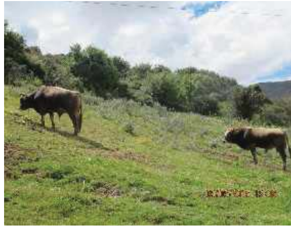
Fotografía N°08: Engorde de Ganado, Comunidad Puca Puca.

sus mismos predios lo cual no es muy conveniente, dado que regatean a precios bajos; las principales ventas lo realizan en las ferias de Andahuaylillas, Mancco y Yutto. Los precios varían de acuerdo al lugar de venta y las condiciones corporales del animal, la venta de animales criollos oscila entre S/.1,500.00 a 2,000.00 N.S. y para vacunos mejorados entre S/.1,800.00 a 3,000.00 N.S.