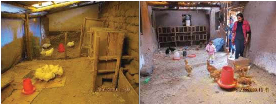
Fotografía N°05 y 06: Asociación Querowasi crianza de aves, 2015 MDA.

La comercialización, lo realizan en sus propios predios, en las ferias dominicales del distrito de Urcos, Ferias y eventos gastronómicos, como también para el consumo, los costos varían por peso entre S/. 30.00 N.S. a S/. 40.00 N.S.