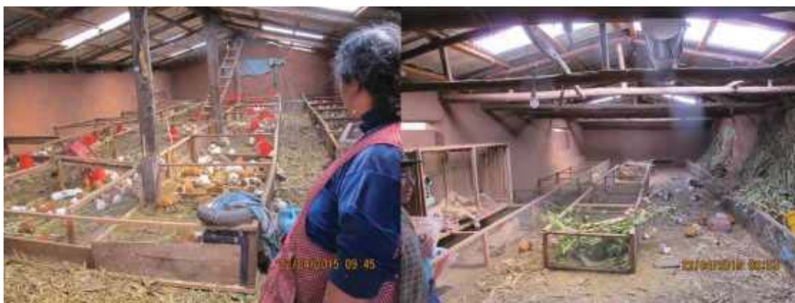
Fotografía N°03 y 04: Comunidad Secsenccalla crianza de Cuyes en galpones.

y la mayoría que vende en sus predios a sus mismos vecinos, práctica que realizan aminorar la consanguinidad.